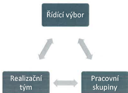
Obrázek 1 Organizační struktura MAP IV ORP Příbram

Podle aktuální potřeby je komunikace mezi členy RT MAP a PS zajištěna prostřednictvím telefonů, e-mailů, sdíleného disku, společné uzavřené skupiny na sociální síti apod. Možnosti jednání lze uspořádat formou prezenční, online i hybridní. Rozhodování na úrovni RT MAP a dalších složek projektu MAP lze formou prezenční i elektronicky, tedy formou per rollam.